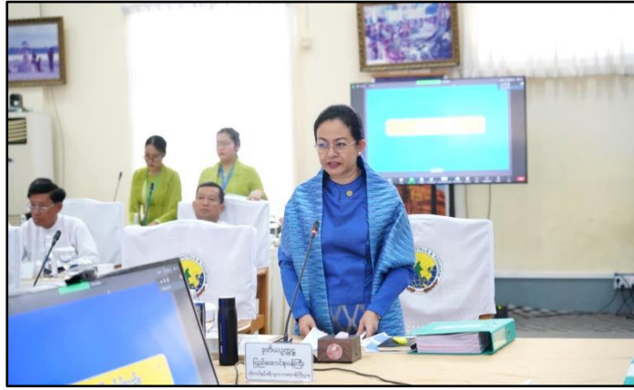
ထို့နောက် အမျိုးသားခရီးသွားလုပ်ငန်းဖွံ့ဖြိုးတိုးတက်ရေးဗဟိုကော်မတီ ဒုတိယဥက္ကဋ္ဌ ဟိုတယ်နှင့်ခရီးသွားလာရေးဝန်ကြီးဌာန ပြည်ထောင်စုဝန်ကြီး ဒေါက်တာသက်သက်ခိုင်က ခရီးသွားလုပ်ငန်းဆိုင်ရာများနှင့်စပ်လျဉ်း၍ ဆွေးနွေးတင်ပြသည်။

သွားလုပ်ငန်းဖြင့်တင်ရေးတို့အတွက် ယနေ့တက်ရောက်လာကြသည့် ပြည်ထောင်စုအစိုးရအဖွဲ့အစည်းများနှင့် ဒေသဆိုင်ရာအစိုးရအဖွဲ့များ အားလုံး အားသွန်ခွန်စိုက်ကြိုးပမ်းဆောင်ရွက်ကြရမည်ဖြစ်ပါကြောင်းပြောကြားခဲ့ပါသည်။