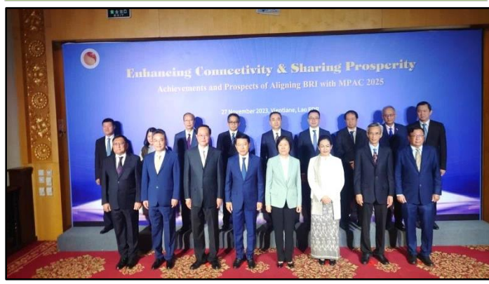
အာဆီယံ-တရုတ်စင်တာမှ ကြီးမှူး၍ “အာဆီယံပေါင်းစည်းမှုဆိုင်ရာ မဟာ